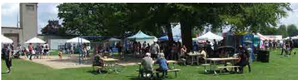
Photo 3 : Quelques-uns des plus de 20 000 visiteurs venus profiter de la bonne vieille hospitalité d'Alliston pendant le festival de la pomme de terre.